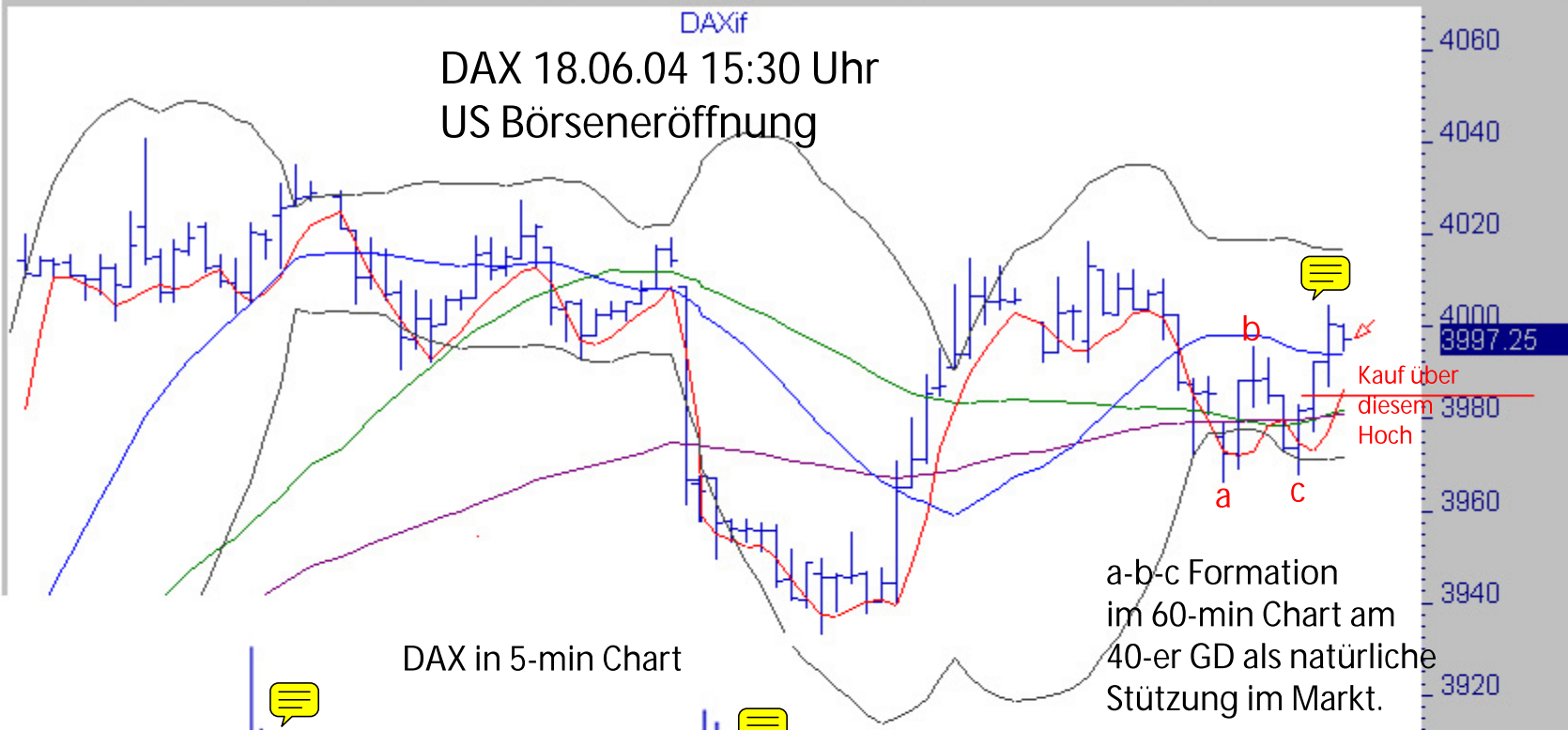
DAX in 5-min Chart