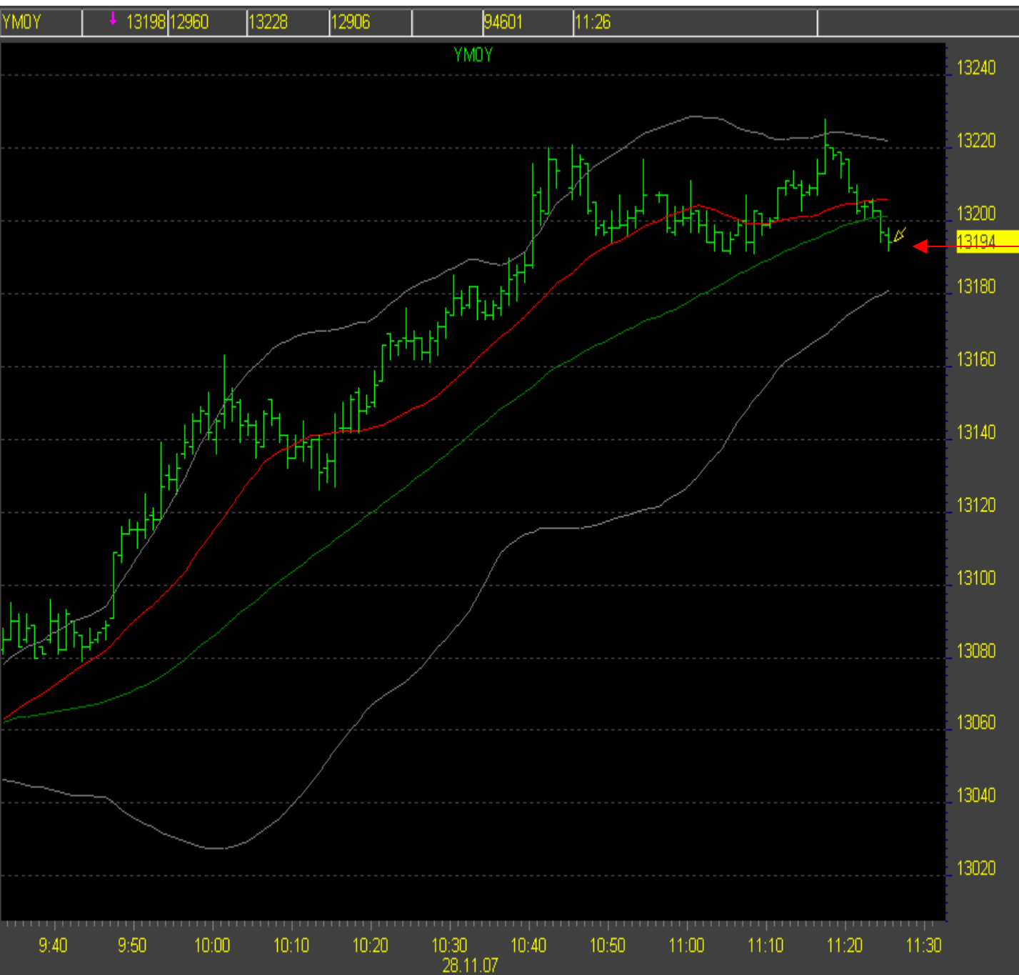
Dow Jones 1-min Chart

Im 1-min Chart fallen die Kurse in das untere Bollinger Band, der Trend ist vorbei