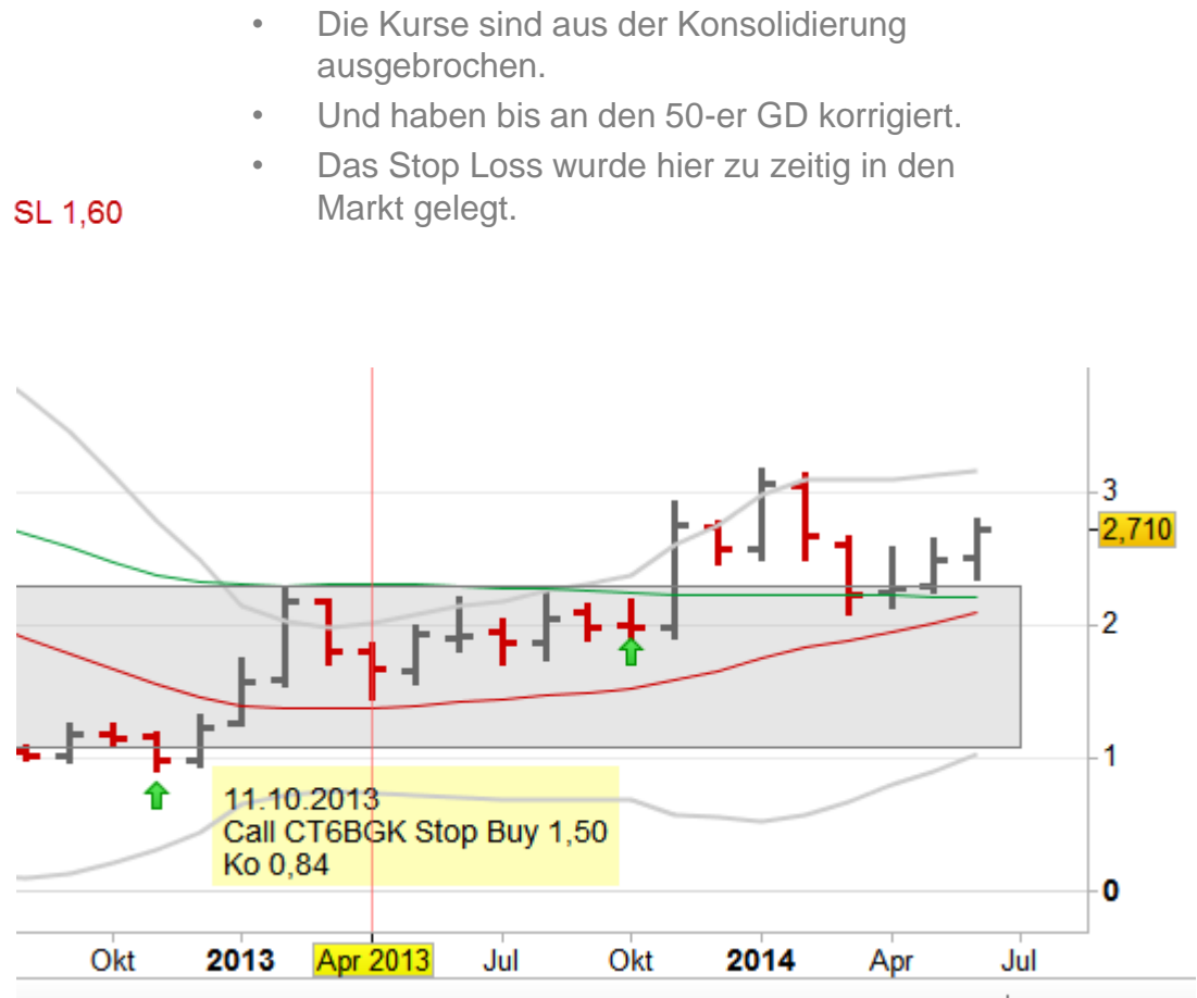
Chart des Basiswertes