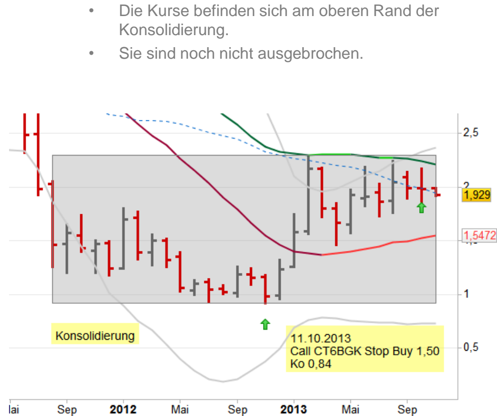
Chart des Basiswertes